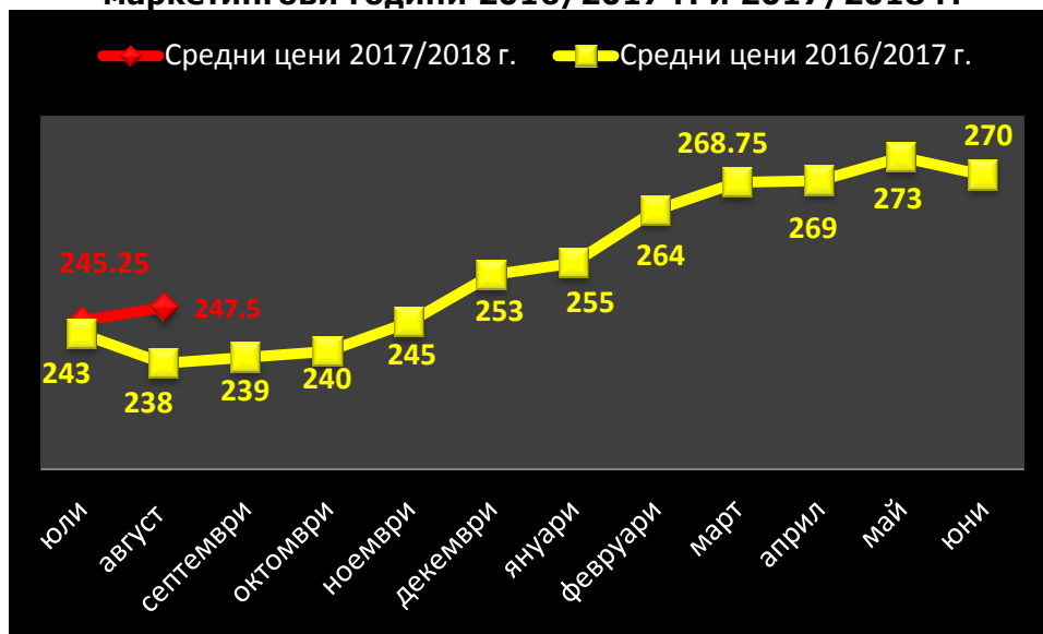
Средни месечни изкупни цени на фуражен ечемик в страната, маркетингови години 2016/2017 г. и 2017/2018 г.

Цената на фуражния ечемик доставен на пристанище бе 265 лв./тон. (източник „Агропортал“).