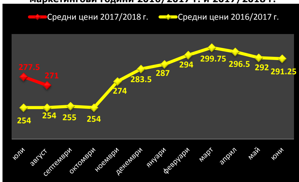
Средни месечни изкупни цени в страната, маркетингови години 2016/2017 г. и 2017/2018 г.

Цената на хлебната и фуражна пшеница доставена на пристанище бе съответно 282 лв./тон и 272 лв./тон.(източник „Агропортал“).