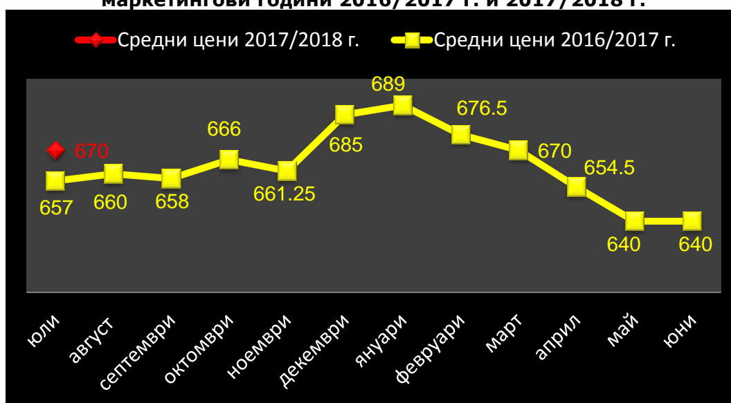
Средни месечни изкупни цени на рапица в страната, маркетингови години 2016/2017 г. и 2017/2018 г.

За изминалият период средната цена на рапицата остана на ниво от 670 лв./тон. За месец юли 2016 г. средната цена е била 657 лв./тон.