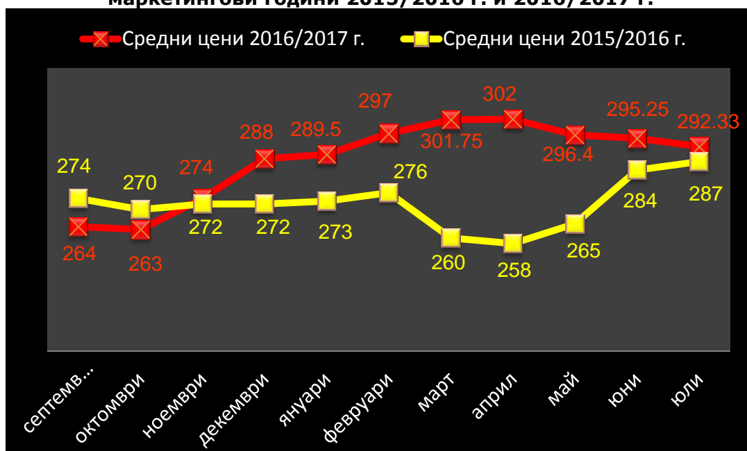
Средни месечни изкупни цени на царевица в страната, маркетингови години 2015/2016 г. и 2016/2017 г.

Средната цена на царевицата през изминалата седмица бе 293 лв./тон. Средната цена за м. юли 2016 г. е била 284 лв./тон.