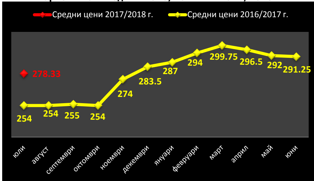
Средни месечни изкупни цени в страната, маркетингови години 2016/2017 г. и 2017/2018 г.

Средната цена на фуражната пшеница също запази нивото си от 264 лв./тон.