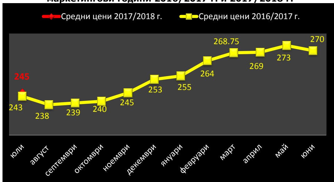
Средни месечни изкупни цени на фуражен ечемик в страната, маркетингови години 2016/2017 г. и 2017/2018 г.

Средната цена на фуражния ечемик реколта 2017 г., през изминалата седмица се повиши леко, от 245 на 247 лв./тон. Средната цена за м.юли 2016 г. е била 243 лв./тон.